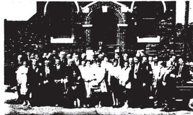
Часць удзельнікаў Сустрэчы перад царквой Жыровіцкае Божае Маці ў Манчэстэры.

У справядачах з розных краінаў выявілася, што большыя беларускіх вэтэранаў за межами акупаванай Башкаўшчыны ня былі й ня ёсць арганізаванай