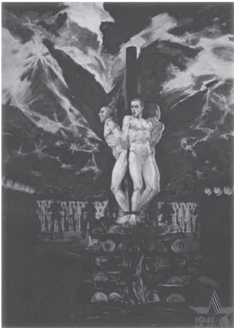
М. Савицкий. Поющие коммунисты